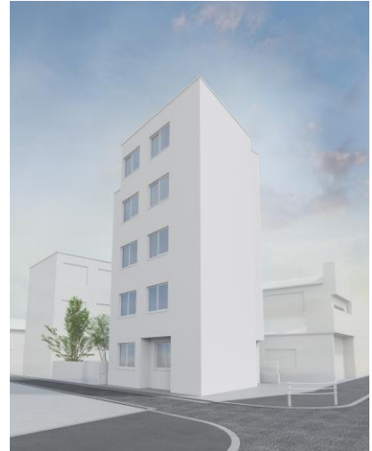
「タスキsmart新中野Ⅱ（仮称）」完成イメージ