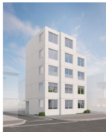
完成イメージ(参考)