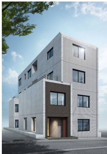
「タスキ Smart落合（仮称）」完成イメージ