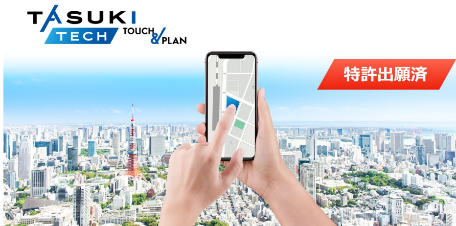
土地活用シミュレーター「TASUKI TECH TOUCH & PLAN」 不動産事業者へ提供開始

不動産テックを活用した新築投資用IoTレジデンスの企画開発を行う株式会社タスキ（本社：東京都港区、代表取締役社長：柏村 雄、証券コード：2987）は、AIを活用した、土地活用シミュレーター「TASUKI TECH TOUCH & PLAN」を不動産事業者へ提供を開始したことを発表いたします。