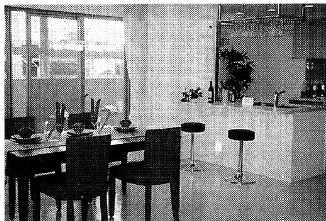
モデルルームのリビング・ダイニング

敷地面積は約2088平方坪、地上15階・地下1階建て。総戸数58戸。間取りは3〜4LDKで、専有面積は約66〜76平方坪。駐車場は敷地内